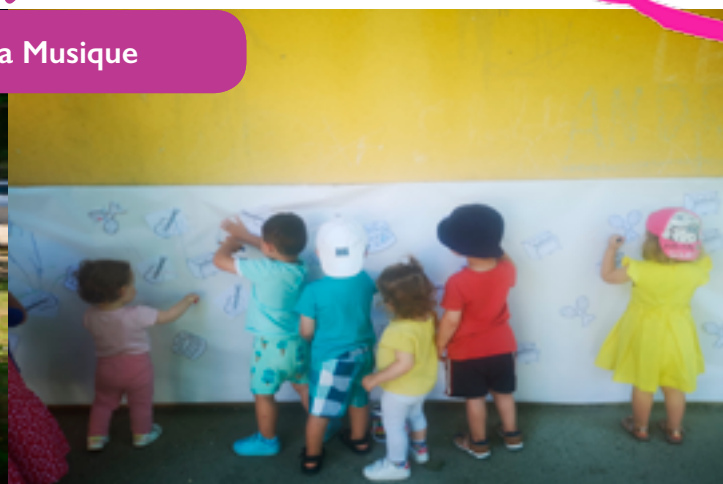
Fête du Centre Aéré