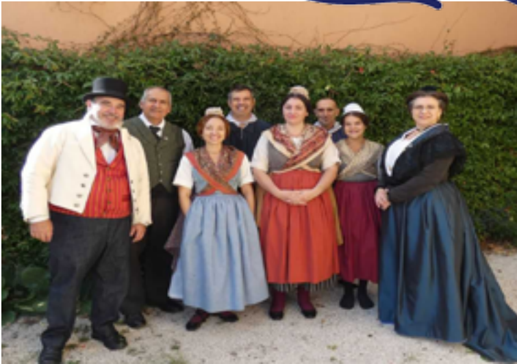
Avec la participation de l'association Li Ricouletto