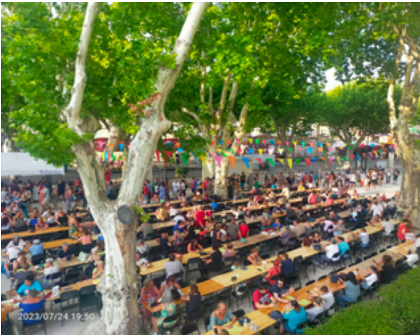
Loto géant des « Saute-Rigoles »