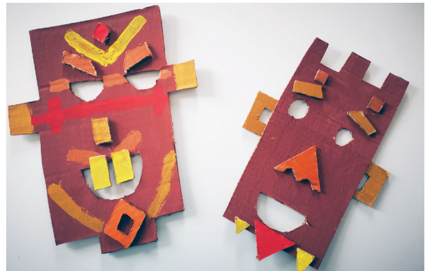
Atelier créatif « Masques Africains »