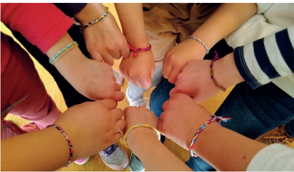
Atelier créatif « Bracelets Brésiliens »