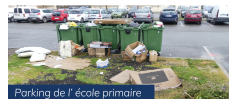
Parking de l'école primaire

Merci pour votre compréhension et votre volonté d'agir.