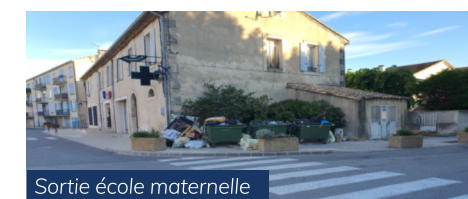
Sortie école maternelle

Montrons chacun l'exemple ! Agissons pour rendre notre village de Cabannes plus propre et plus beau.